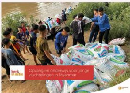
Opvang en onderwijs voor jonge vluchtelingen in Myanmar

Als gevolg van de langdurige conflicten in het Zuidoost-Aziatische land Myanmar (Birma) zijn veel inwoners over de grens met buurland Thailand gevlucht. Met steun van Kerk in Actie worden kwetsbare kinderen en jongeren opgevangen en krijgen ze verzorging en scholing.